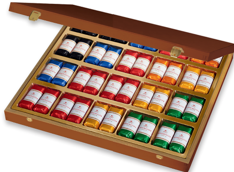
Präsentkiste mit Gravur