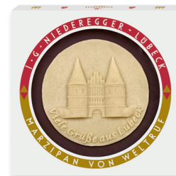
Marzipan Torte mit individuellem Aufleger aus Marzipan