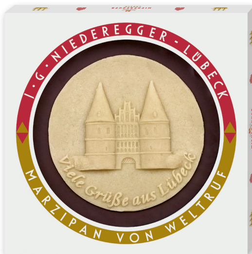
Marzipan Torte, 250 g mit individuellem Marzipan Aufleger

Von Meisterhand aus feinem Marzipan gefertigt: Taler, Torten und Platten mit individuellem Aufleger (Logo, Motto, Motiv).