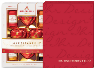
Marzipanerie, 100g mit Schubler