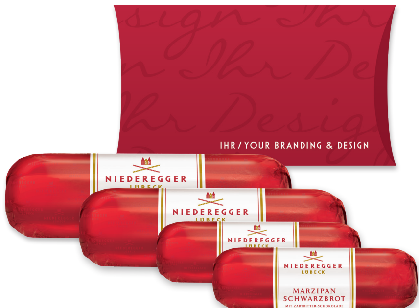
Marzipan Brote, von 48 g – 200 g

Für jede Zielgruppe ein passendes Angebot.