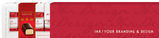
Marzipan Klassiker®, im 100 g Schubler