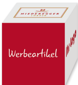
Würfel mit 2 Herzen

So hinterlassen Sie mit jedem Werbegeschenk einen geschmackvollen Eindruck.