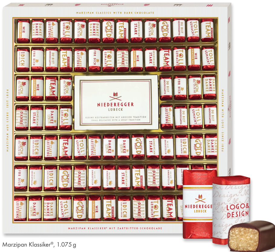
Marzipan Klassiker®, 1.075 g

Perfekt für jeden Anlass als Geschenkpackung oder auch einzeln als Give-Away.