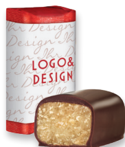
Marzipan Klassiker®, 12,5 g mit Banderole