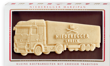
Marzipan Platte, 250 g mit individuellem Marzipan Aufleger