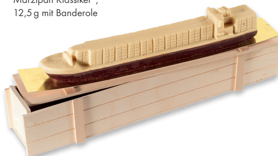
Marzipan Kunst, 3-D Modell nach Ihren Vorgaben