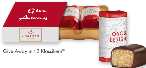
Give Away mit 2 Klassikern®