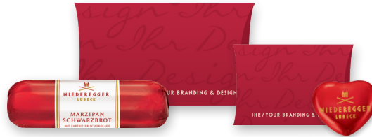
Kissen-Packungen für Marzipan Brote, Herzen und Sterne