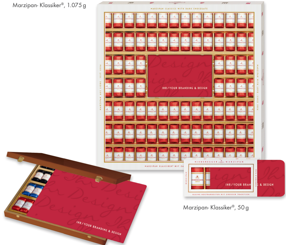
Marzipan-Klassiker®, 50 g