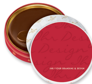
Marzipan Torte in der Dose, 75 g und 185 g