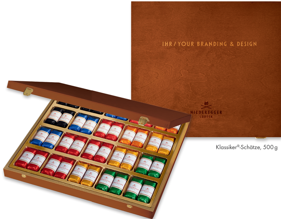
Klassiker®-Schätze, 500 g

Lassen Sie Ihren Geschäftspartnern oder Mitarbeitern einen persönlichen Dank mit einer individuellen Botschaft zukommen.