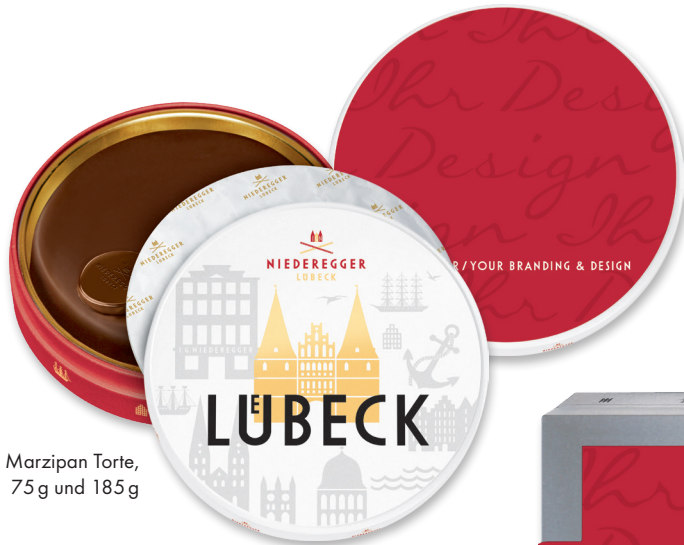
Marzipan Torte, 75g und 185g

Ob rund oder eckig, mit den Niederegger Dosen haben Sie für jeden Anlass das passende Geschenk.