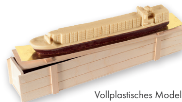
Vollplastisches Modell nach Ihren Wünschen