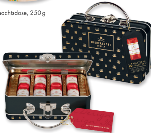
Reisekoffer mit 16 Klassikern®, 200g