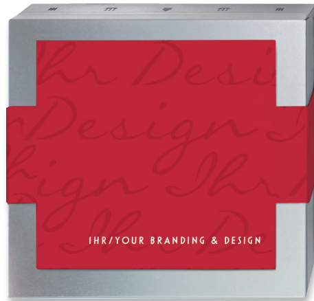
Silver Edition, 225g