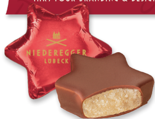
Kissen-Packung mit Sternen, Herzen oder Tannenbäumen